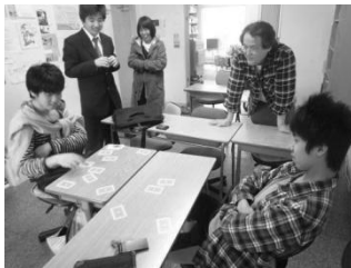
神経衰弱で真剣勝負！